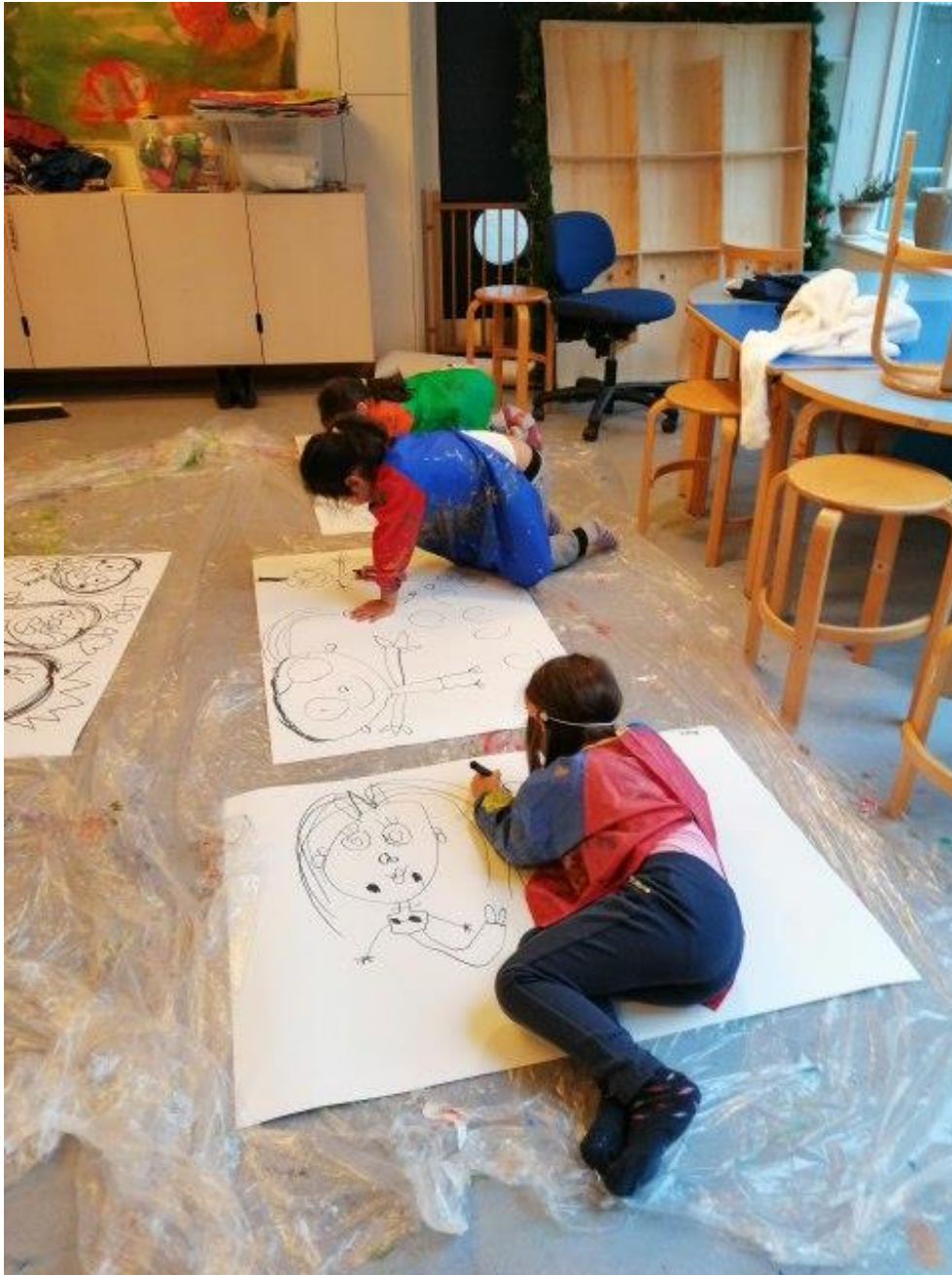
Her er et eksempel på en aktivitet som er sat i gang af en voksen, hvor temaet er krop og bevægelse